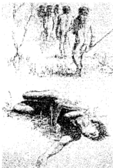
prima: senza sepoltura

rompere, per tagliare, per cacciare, per pescare, per difendersi dagli animali. Gli animali quando muoiono rimangono per terra. Anche i primi uomini morti rimanevano per terra come gli animali. Adesso però l'uomo cambia. Adesso mette i morti sotto la terra, in un buco. Questo si chiama sepoltura.