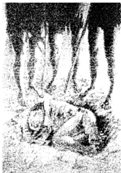
dopo: con la sepoltura