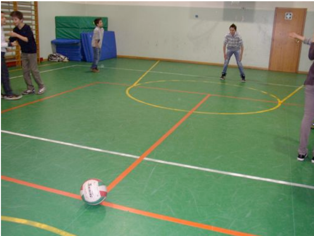
Le nostre parate...