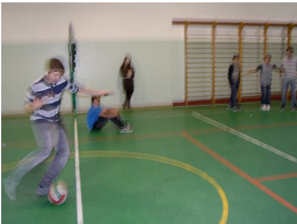
calciamo in porta...