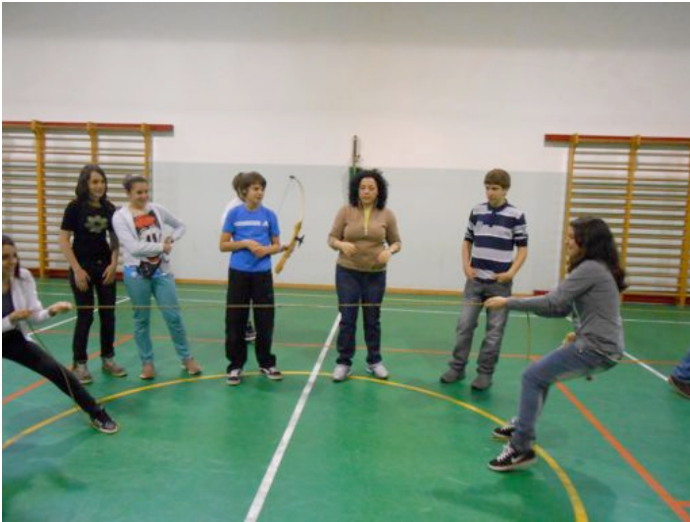
Tiro alla fune