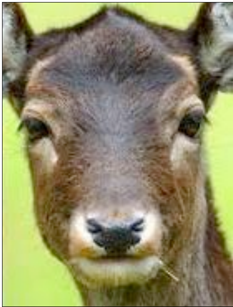
FIGURE UMANE E ANIMALI GIA' ABBINATE 1

Si mostrano le seguenti immagini per categoria (animali e figure umane non in abbinamento).